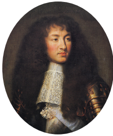
Portrait du jeune Louis XIV par Charles le Brun (1619-1690).