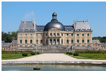
Le château de Vaux-le-Vicomte, construit par Fouquet entre 1658 et 1661.