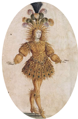
Louis XIV en Apollon dans le ballet de la nuit ; Apollon = dieu du soleil et des arts 1 . Graphique par Henri Gissey (1653).