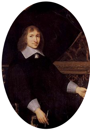
Portrait de Fouquet par Charles Le Brun.