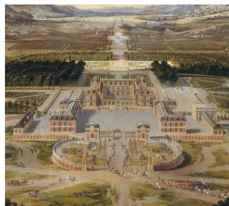
Château de Versailles, vers 1668, peinture par Pierre Patel ; la cour et le roi n'y résideront de manière permanente qu'à partir de 1682.