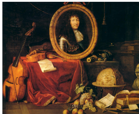
« Louis XIV protecteur des arts et des sciences » par Joseph Garnier (1632-1705).